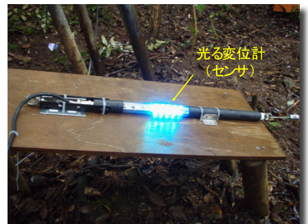
光る変位計の設置状況