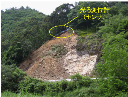
吹付け法面の崩落現場状況