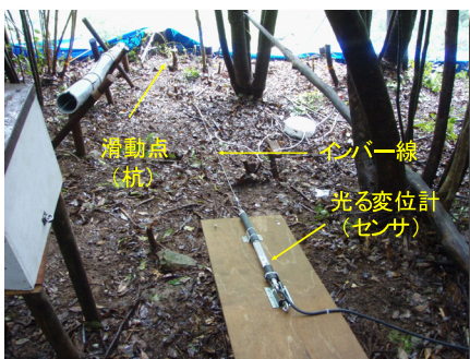
光る変位計と滑動点の連結状況