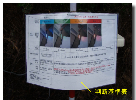
光の色による判断基準表