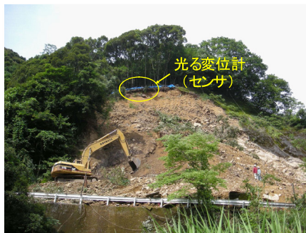
復旧対策実施状況