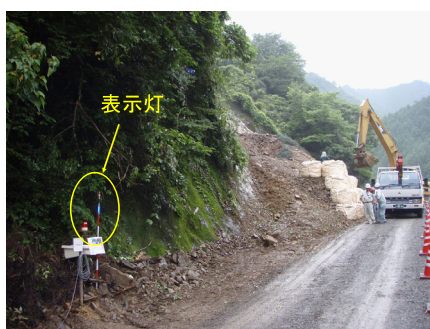
表示灯の色による安全監視